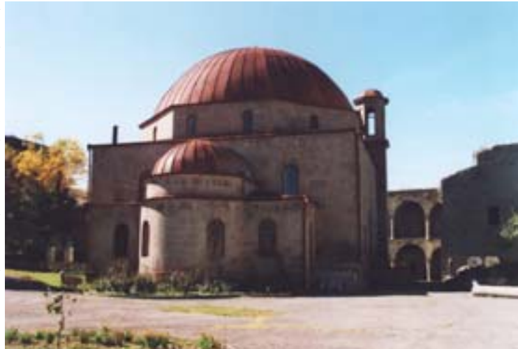
Old mosque in Akhaltsikhe on the castle without minarets.

Les familles de Meshkets auxquelles la délégation a rendu visite dans la ville Achalziche sont bien intégrées et n'ont su faire rapport d'aucune discrimination de la part d'habitants géorgiens et arméniens. Par contre, des difficultés sont causées par différentes mesures bureaucratiques (telles que le refus de la nationalité ou de changement de nom). Les services du gouvernement du rayon, aussi, causent apparemment des obstacles. Une conversation avec un responsable du gouvernement du rayon a été refusée à la délégation alors qu'elle a été très vite confrontée à un groupe d'autochtones, qui a insulté le Conseil d'Europe et affirmé l'impossibilité du rapatriement des Meshkets dans la région. La télévision qui était également sur place (!) a parlé d'une manière approfondie d'un « soulèvement populaire » qui ne pouvait être en réalité qu'une action organisée par le gouvernement régional. Il est