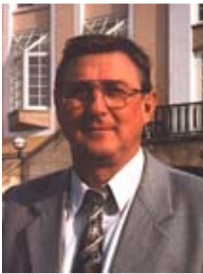
FUEV-Vizepräsident Bela Tonkovic

In der Zeit vom 29. März bis zum 3. April 1998 besuchte eine FUEV-Delegation bestehend aus FUEV-Präsident Romedi Arquint und die beiden FUEV-Vizepräsidenten