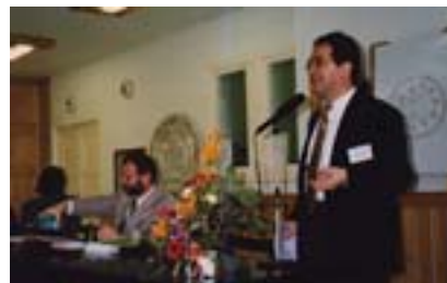
Unter den Teilnehmern: FUEV-Präsident Romedi Arquint (rechts) und FUEV-Vizepräsident Dr. Ludwig Elle

ternational besetzte Konferenz zum Thema »Kultur, Bildung und ethnische Identität«. Neben Lageberichten verschiedener nationaler Minderheiten wurde ausführlich auch auf die aktuelle Lage in Rumänien eingegangen. Die Konferenz verabschiedete eine Resolution, die die wichtigsten Grundsätze bei der