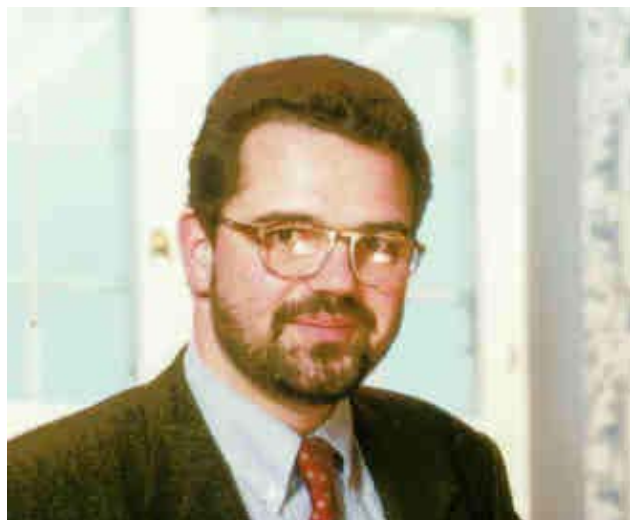
Stefan Troebst ist Direktor des dänisch-deutschen »European Centre for Minority Issues« (ECMI) in Flensburg und Privatdozent für Neuere sowie ost- und südosteuropäische Geschichte an der Freien Universität Berlin.

aus Der Tagesspiegel, Nr. 16.235 30.01.1998, S. 8