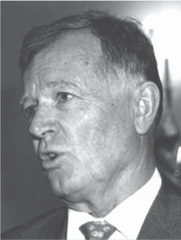
Jean L. Chretien